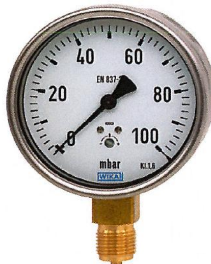
Kapselfederdruckmessgerät Typ 612.20